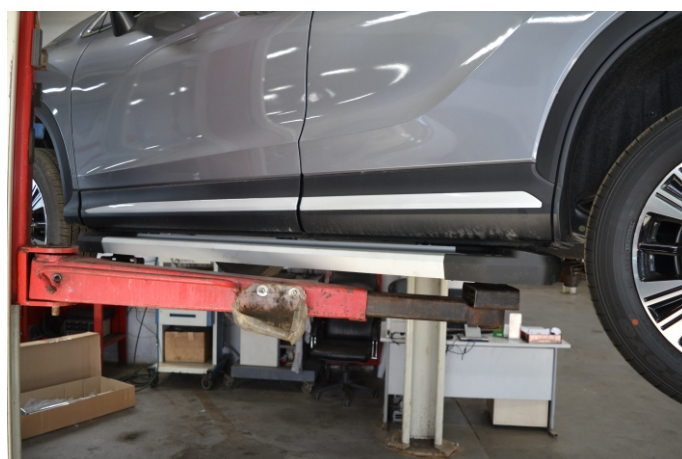
Общий вид автомобиля с порогом

Перед установкой изделия необходимо убедиться, что автомобиль, на который планируется установка, соответствует модельному ряду, указанному в настоящей инструкции. В случае затруднений с определением соответствия обращайтесь службу технической поддержки supp@rivalauto.com . В случае наезда на препятствие необходимо убедиться в отсутствии повреждений и агрегатов автомобиля и пригодности дальнейшей эксплуатации порогов. При правильной установке пороги не должны касаться узлов и агрегатов автомобиля. Производитель вправе вносить изменения в конструкцию порогов.