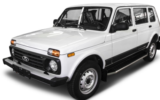
Общий вид автомобиля с порогом

Перед установкой изделия необходимо убедиться, что автомобиль, на который планируется установка, соответствует модельному ряду, указанному в настоящей инструкции. В случае затруднений с определением соответствия обращайтесь службу технической поддержки supp@rivalauto.com . В случае наезда на препятствие необходимо убедиться в отсутствии повреждений и агрегатов автомобиля и пригодности дальнейшей эксплуатации порогов. При правильной установке пороги не должны касаться узлов и агрегатов автомобиля. Производитель вправе вносить изменения в конструкцию порогов.